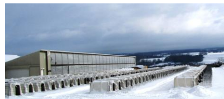
In de presentatie wordt verteld over onze transitie ervaringen bij -20 C in Amerika.

Zoals het preventieprogramma Dry2Fresh*, dat de diepte van de dip op uw bedrijf exact in kaart brengt. Zo weet u precies welke punten u kunt aanpakken om uw koeien goed door de transitieperiode te helpen. Dat is prettig voor de koeien en prettig voor u!